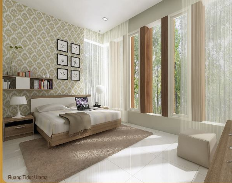
Ruang Tidur Utama