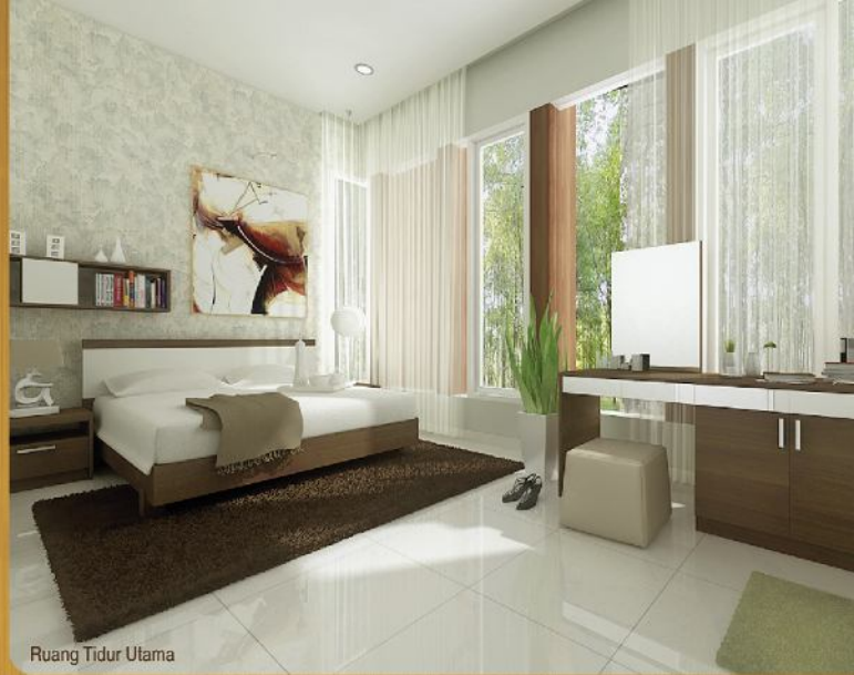
Ruang Tidur Utama